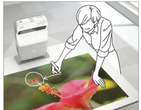
Projicera på vilken horisontell yta som helst som till exempel ett bord